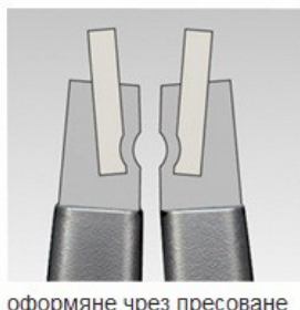
оформяне чрез пресоване