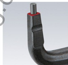
Стабилни, поставени върхове от високо уплътнена пружинна стомана