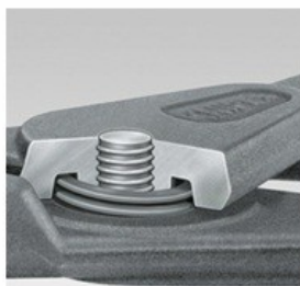
Пружина монтирана в шарнира: предпазва инструмента от повреда, замърсяване или загуба. Осигурява сигурна работа

За върховете се използва висококачествена стомана с гладка повърхност. Вследствие на това върхът е устойчив на динамично и статично натоварване. Върховете при еднократно натоварване са с 30 % по-стабилни в сравнение с традиционните клещи, при същевременно добра достъпност при монтажа. При динамично натоварване върхът издържа до 10 пъти по-дълго! При прецизните зегер клещи върховете се закрепват чрез студена обработка. Върховете са неотделими!