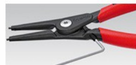
Форма 3 / форма 4: с регулируем ограничител на отварянето