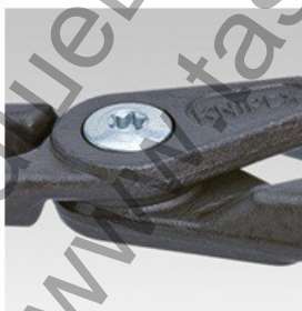
Шарнир свързан с болт: висока прецизност и оптимална подвижност