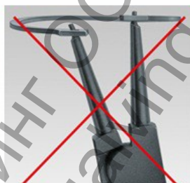
Традиционни зегер клещи: Възможно усукване на пръстена при монтаж